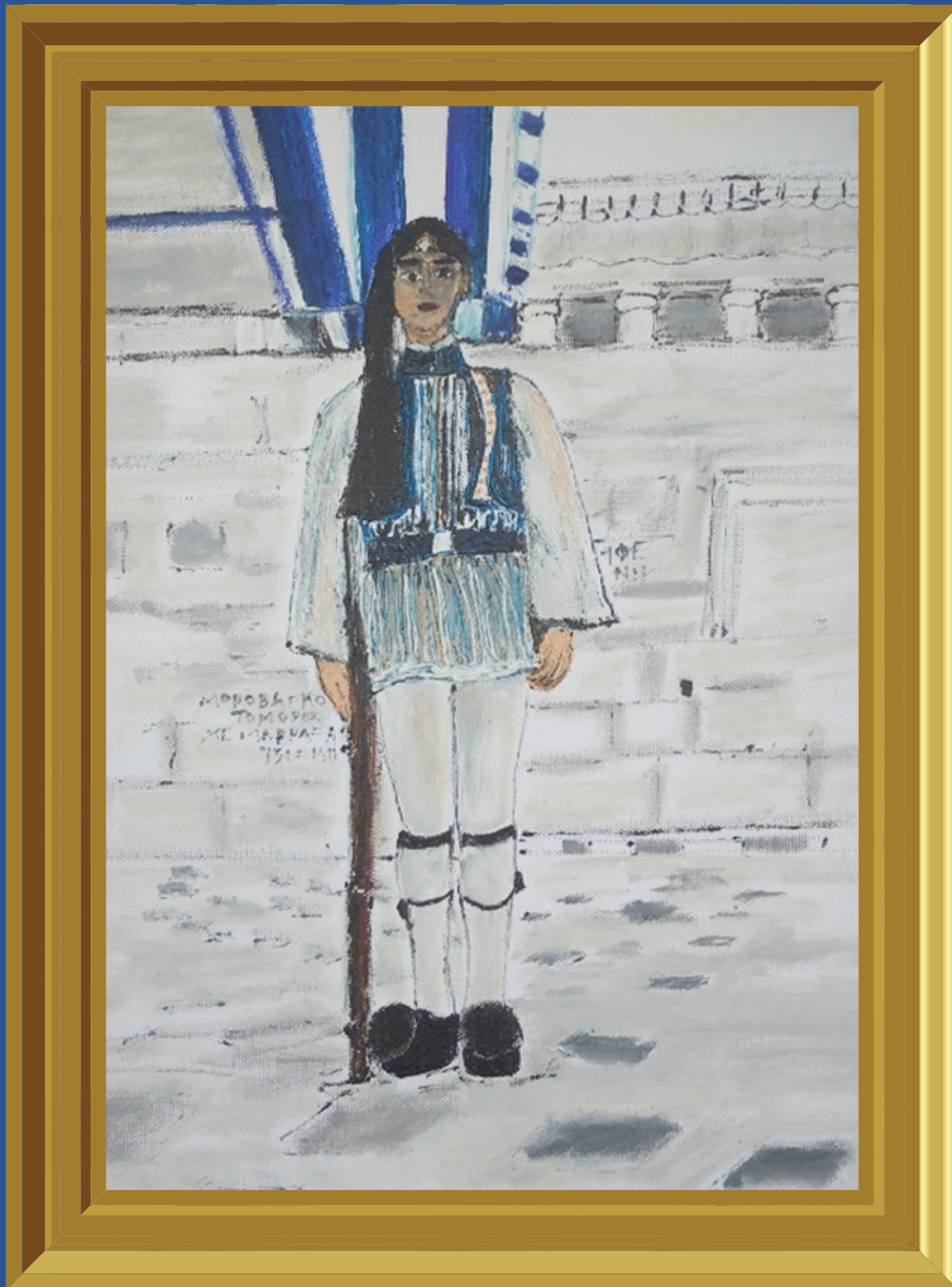
Το έργο είναι δημιουργία της ζωγράφου Κατερίνας Καλούδη. Την ευχαριστούμε για την προσφορά της.