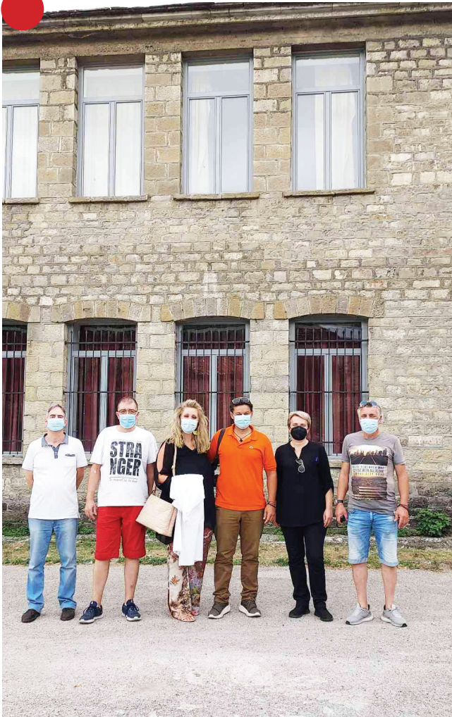
Η ομάδα Αιμοδόσιας του Πανεπιστημιακού Νοσοκομείου Ιωαννίνων