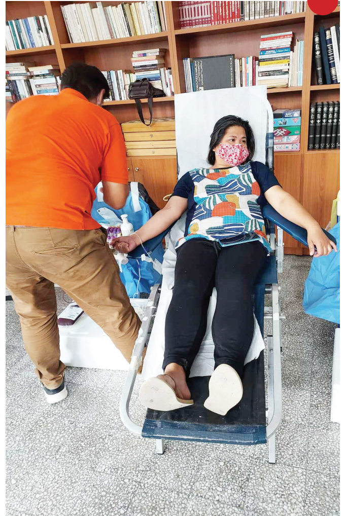
Η αιμοδοσία έγινε 11 Αυγούστου σε αίθουσα του δημοτικού σχολείου. - Έδωσαν αίμα 20 άτομα