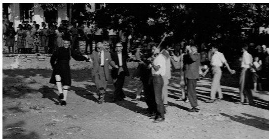
Χορός στην κεντρική πλατεία του χωριού μεταπολεμικά