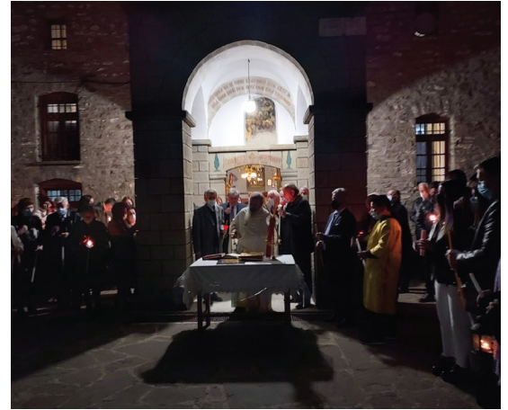
Ανάσταση στο χωριό μας.

Επιτάφιος και περιφορά: «Ο ευσχήμων Ιωσήφ από του ξύλου καθελών το άκραντόν σου Σώμα, σινδόνι καθαρά ειλήσας και αρώμασιν, εν μνήματι καινώ κηδεύσας απέθετο.»