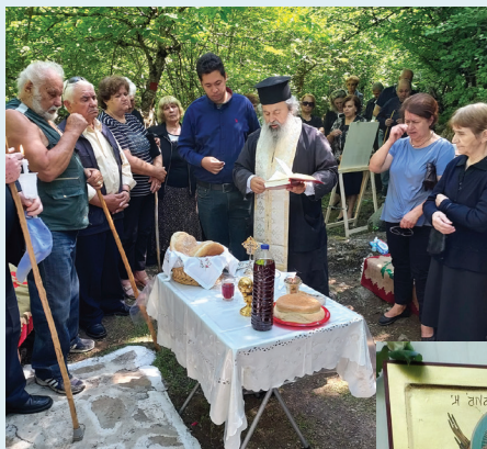
Ανάληψη: Τιμήσαμε την Ανάληψη του Κυρίου μας με το ευκέλαιο και την αρτοκλασία στο παρεκκλήσι της Ανάληψης στο Κρουονέρι.