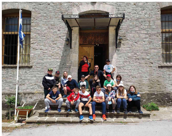
Επίσκεψη μαθητών από την Ορεστιάδα, στο Λαογραφικό μουσείο του χωριού μας.