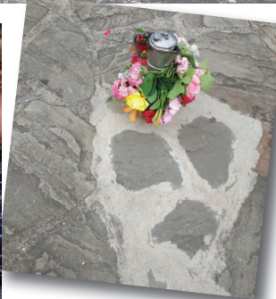
Γιορτάστηκε το έθιμο του Αριγογιάννη και φέτος στο χωριό μας.