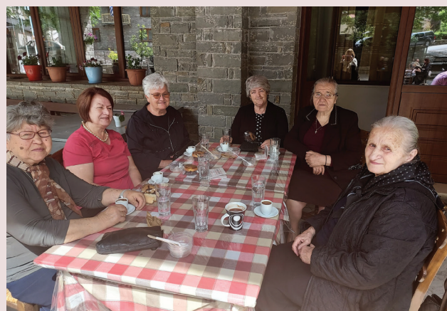
Ξεχωριστές στιγμές στην πλατεία του χωριού μας κάτω από τον περήφανο πλάτανο και το φως του λαμπρού ήλιου. Η απόλαυση του καφέ για τις Κερασοβίτισσες γυναίκες και η πεποίθηση που δίνει το τσίπουρο για την απόσταξη του χρόνου, για τους Κερασοβίτες άνδρες, καταγράφεται στα πρόσωπα των φωτογραφιών.