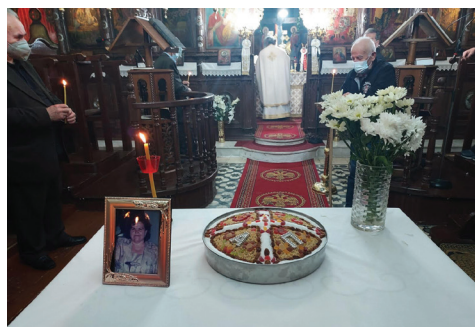
1 Μαΐου το ετήσιο μνημόσυνο της Γραμματέας μας Ανθούλας Παστουρμά.