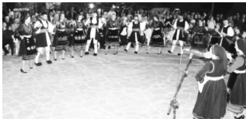
Το εφηβικό, πάνω, χορευτικό και αυτό των ενηλίκων στις περσινές πολιτιστικές εκδηλώσεις.