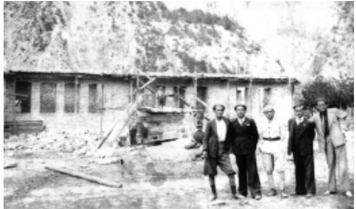
Ανέγερση νέου δημοτικού σχολείου 1939.

Από του έτους 1801 μέρι σήμερα υπηρετήσαν διδάσκαλοι εν όλω 190...».