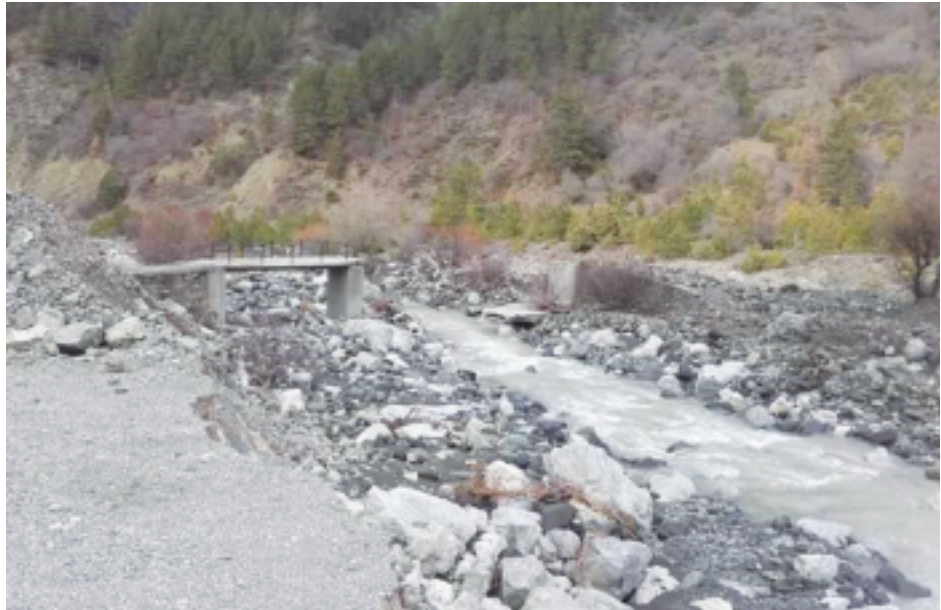
Το γεφύρι στα Ξυλουράκια μισογκρεμισμένο.

Τα γεφύρια φτιάχτηκαν σε πρώτη φάση για να περ-