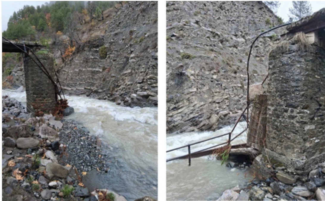
Το γκρεμισμένο γεφύρι στο Λιβάδι