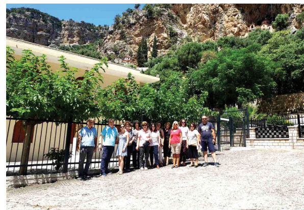
Επίσκεψη στον Παπαζούκα Προσκύνημα Κερασσοβιτών στον Παπαζούκα