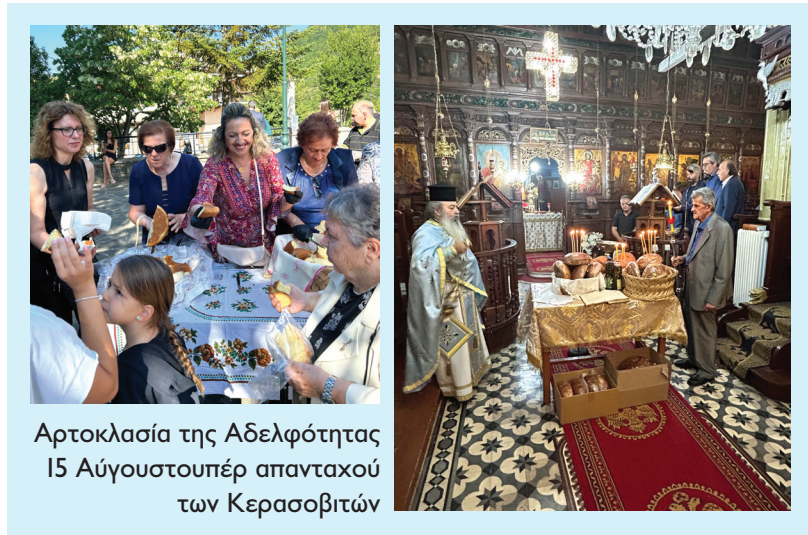
Αρτοκλασία της Αδελφότητας 15 Αύγουστουπέρ απανταχού των Κερασσοβιτών

Τιμήσαμε τους ήρωες προγόνους μας με το τρισάγιο από τον Μητροπολίτη Δρυϊνουπόλεως Πωγωνιανής και Κονίτσης κ. Ανδρέα και τον πατήρ Μιχάλη στην προτομή του Κερασσοβίτη Ήρωα που στήθηκε στη μνήμη των πεσόντων προγόνων μας για την απελευθέρωση του χωριού από τον Οθωμανικό ζυγό τον Ιανουάριο του 1913. Το τρισάγιο έγινε μετά το πέρας της Θείας Λειτουργίας την Κυριακή 6 Αυγούστου 2023 στην κεντρική μας εκκλησία της Κοίμησης της Θεοτόκου και θα τελείε κάθε χρόνο την πρώτη Κυριακή του Αυγούστου.