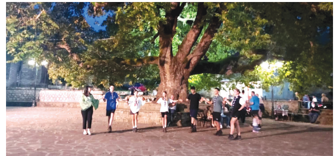
Οι πρόσκοποι χορεύουν τος Κερασοβίτικους και Κερκυραϊκούς χορούς κατω από τον Πλάτανο