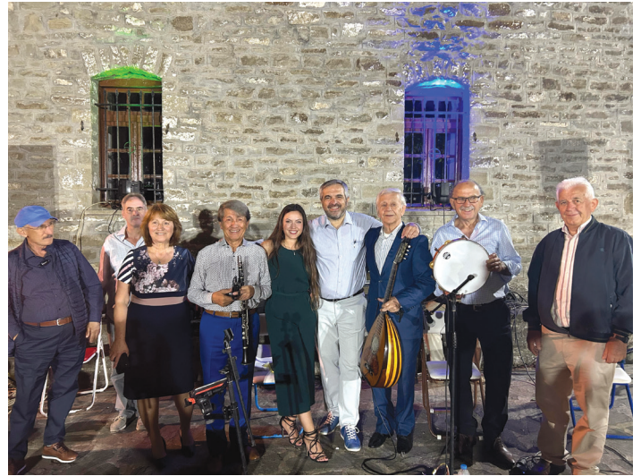
Μέλη της Αδελφότητας

μας και όλα αυτά που πάντα θα μας ενώνουν και θα μας κάνουν να αγαπάμε το χωριό μας.