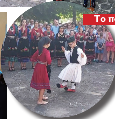
Το πανηγύρι του χωριού μας